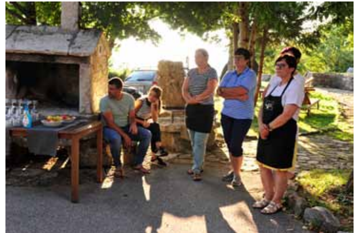
Družina Vidmar – prijazni gostitelji kolonije Umetniki za karitas že od leta 1995