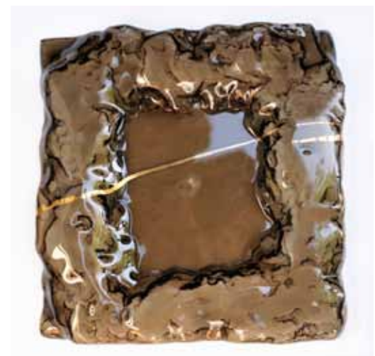
Mira LIČEN Pladenj, 2020 fuzija stekla s pozlato