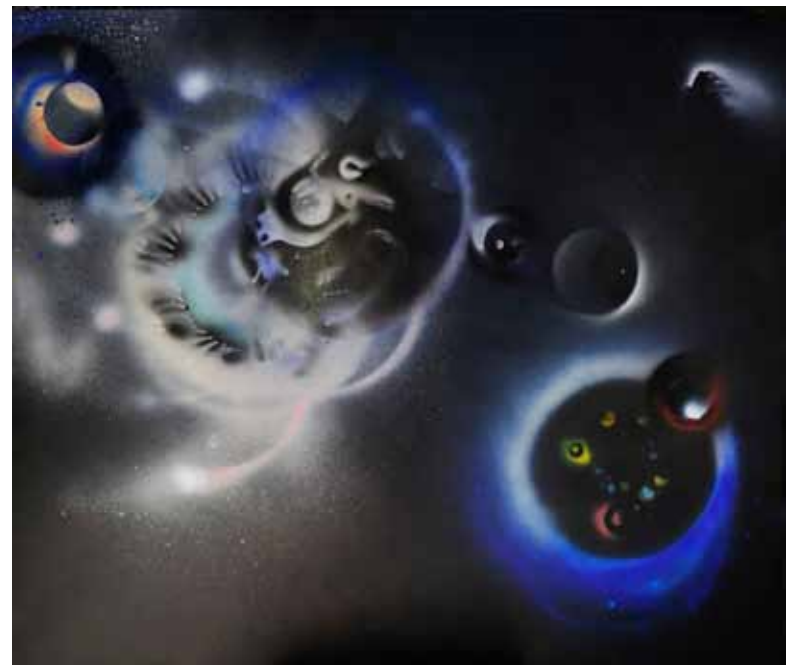
Milan ERIČ Luč sveta, svet luči, 2020 olje na platnu

Barbara Demšar ustvarja krajine, ki niso odsev stvarnega stanja, temveč skozi izrazito avtorsko preobrazbo postajajo del imaginarnega krajinskega prostranstva. S kompozicijsko gradnjo sledi prostorskemu redu, za katerega se zgleduje v naravnem. Zasnove njenih del so namreč horizontalne. Na sliki Živelo življenje, ki je razdeljena na dva barvna pola, iz zgornjega roba slikovne ploskve v prostor sije na znakovnost reducirano sonce. S svojo močjo iluminira celotno prizorišče, ki je tudi sicer odeto v slikarki priljubljene tople barve. Na njem najdejo svoje mesto kolažne aplikacije, ki kljub svoji izraziti oblikovni poenostavljenosti asociirajo na izbrane krajinske elemente. To so drobna znamenja slikarkine krajine, reducirana na znakovnost in koncentrirana v govorico simbolov. Z leti so pridobila arhetipsko prepoznavnost, a še vedno ostajajo odprta za oblikovna poigravanja. Avtorica jih izgrajuje tudi z linijo, ki jo ustvarja klasično risarsko ali pa z lepljenjem nitk. Tovrstnim ilustrativnim utrinkom dodaja mikrostrukturalno dogajanje nežno vzorčastega ozadja. Z njim tke atmosfero, naglašuje živost slikovne povrhnjice in dosega optične vrednosti nekakšnega sekundarnega vzorca oziroma moiré efekta.