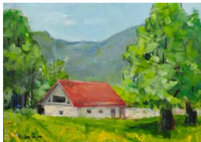
Janez OVSEC Pomlad na deželi, 2019 akril na platnu