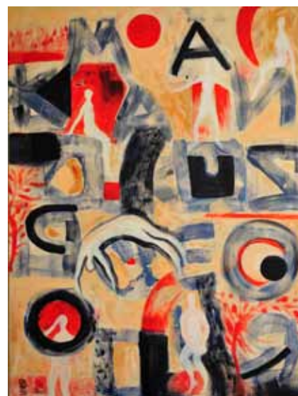
Lona VERLICH To je življenje, 2020 akril na platnu