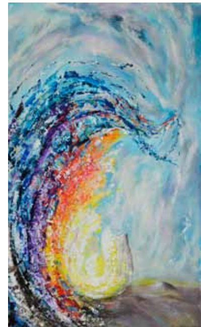
Igor ZIMIC Luč, 2020 akril na platnu