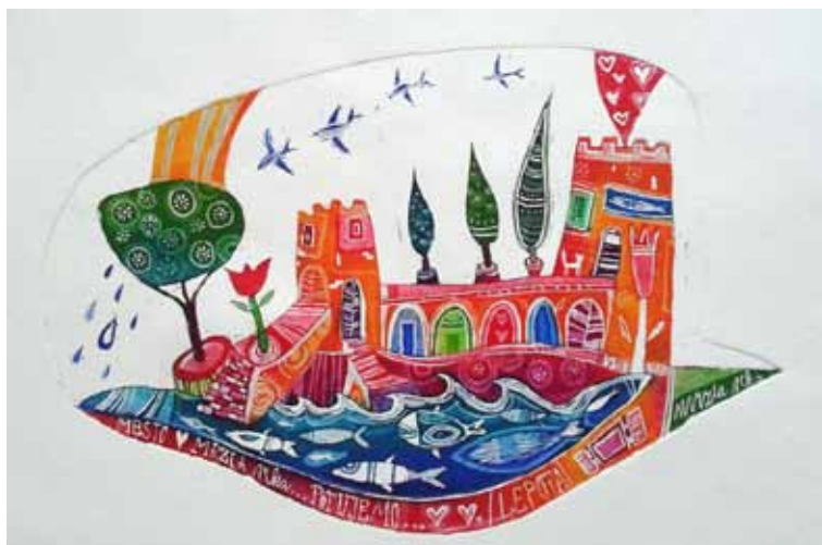
David LIČEN Mesto oob mrzli reki, 2011 akvatinta