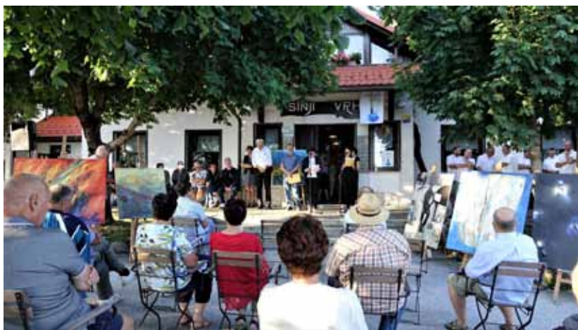
Prva razstava nastalih del je kar na Sinjem vrhu. Na pot jo je pospremil tudi koprski škof msg. Jurij Bizjak.