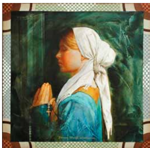
MAŠA BERSAN Mašuk Zdrava Marija milosti polna, 2020 akril na platnu