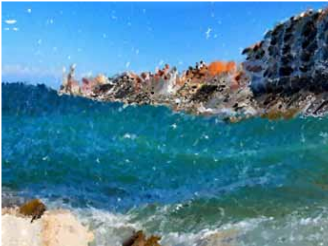
BOGDAN SOBAN Pred nevihto, 2020 digitalni tisk na platnu