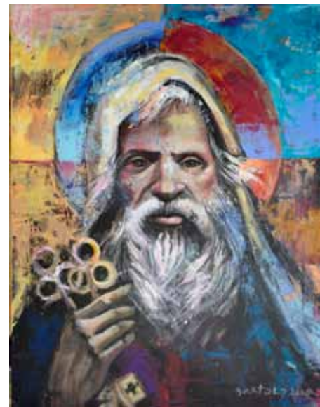
Jože BARTOLJ Sv. Peter, 2020 akril na platnu