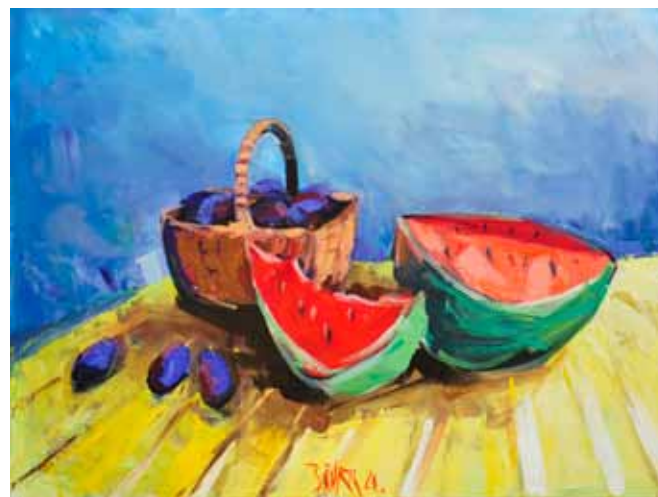
Pavle ŠČURK Tihožitje, 2020 akril na platnu