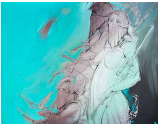
Nikolaj MAŠUKOV Maske, 2020 akril na platnu