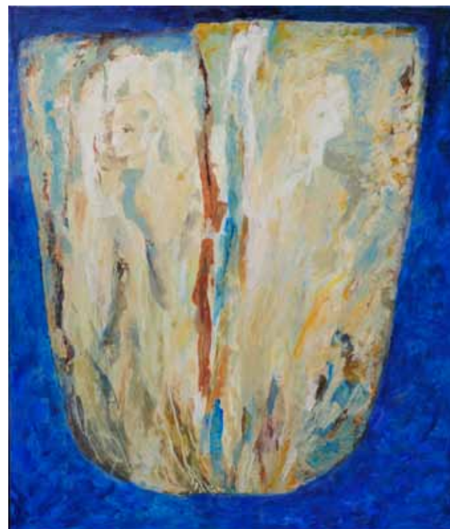
Silva COPIČ Ujeta v čas, 2020 akril na platnu

Za Skenderja Bajrovića je narava motivna fascinacija. Čuti njeno živost, moč in energijo, subtilno zaznava njene barve, igre svetlobe, njene ritme in zvoke. Svoja zrela ustvarjalna zanimanja posveča predvsem tematiki vode ter išče njeno refleksijo v barvi in zvoku. Svet zunanjega ponotranji, v njem odkriva bistveno, tisto, kar se je zasedrilo v njem samem in dozorelo za novo likovno življenje, v katerem utripata predanost barvi in gesti. Slikovne kompozicije so polne notranje dinamike, vendar skozi premišljeno arhitektoniko zazvenijo v ravnovesju. Barve, svetloba in platenja mu omogočijo, da jih odpira v prostorske dimenzije. Slikarjev intenzivni barvni register, razpet med zunanjo resničnostjo in notranjim čutenjem, se je še posebej izživel na sliki Vi ste luč sveta . Iz toplo-hladnih soočanj v spodnjem delu je prešel v izjemno žarenje toplih, intenzivnih, iluminiranih vrednosti, v ognjenost in magičnost. Poteze, s katerimi avtor večplastno tke slikovno tkivo, so prevod izvornosti narave in avtorjeve ekspresivne vzdramljenosti. Z njimi pušča različne sledi, vendar vselej neposredne, impulzivne, odločne, gibke in občutljive. Z njimi vzpostavi ritem rastoče kompozicije, ki poseduje vzgonsko moč za prestop v sfero presežnega.