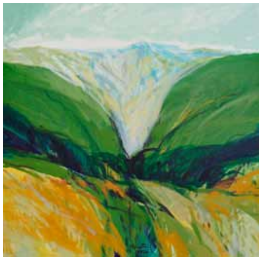
Lucijan BRATUŠ SV-02, 2020 akril na platnu