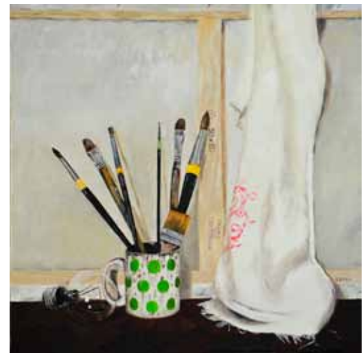
Silva KARIM Platno in sedem čopičev, 2020 olje na platnu