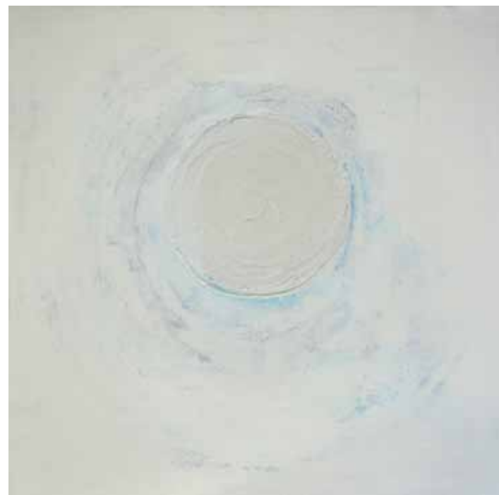
Breda ŠTURM Odpri A, 2020 akril na platnu

Viktor Šest na slikovni oder postavi najrazličnejše figuralne like. Izbira jih iz preteklosti in sedanjosti, iz javnega in zasebnega življenja, vselej znova pa se druži z glasbeniki. Junaki so zgovorni pripovedovalci, so akterji različnih življenjskih situacij in vlog. Na slikovnem odru jih utelesi z risbo, ki je karakterno individualna, močna, tekoča, dinamična, virtuozna in v segmentih celo eruptivno dramatična. Odlična risba je samozadostna, hkrati pa odprta za barvno nadgradnjo. Avtor z barvami dodatno modelira telesnost svojih figur, izpostavlja posamezne fragmente, uglaši in naglasi razpoloženje, ustvari in osvetli prostor ter z izborom konceptualno sledi motivu in njegovi atmosferi. Šestovi figuralni liki predstavljajo obvladovanje in upoštevanje pravil oz. kanonov klasičnega portretnega slikarstva, ki mu v želji po stopnjevanju izraznosti dodaja načine sodobnega oblikovanja telesnosti, pristope, značilne za modernistično stilizacijo, predvsem pa rešitve, ki so izrazito avtorsko intimne ter služijo slikarjevi želji, da bi bila njegova figura živa, duhovita, intenzivno nagovarjajoča. Tokrat se je poglobljeno posvetil glasbenikom v posebnem umirjenem uprizoritvenem trenutku in vzdušju interierja, temperamentni plesalki flamenka ter baletki, ki se pripravlja na svojo vlogo.