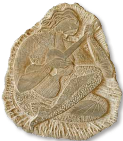
Stojan BATIČ (iz zapuščine DJ) Deklica s kitaro kamen