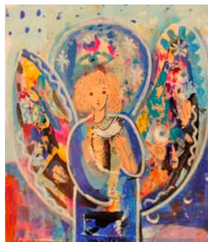
Marta JAKOPIČ KUNAVER Angel, 2020 mešana tehnika na papirju