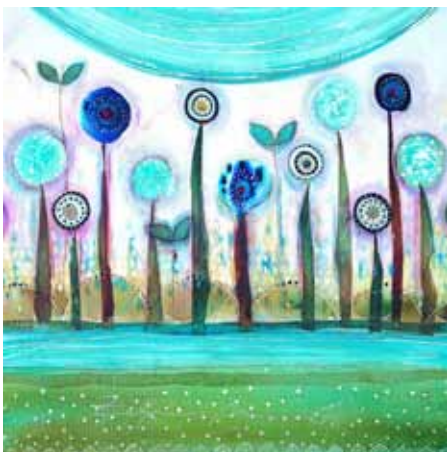
Nina ZULJAN Moja dežela, 2020 akril na platnu