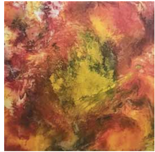
Janez ŠTROS Tudi ti si angel, 2019 tisk na platnu