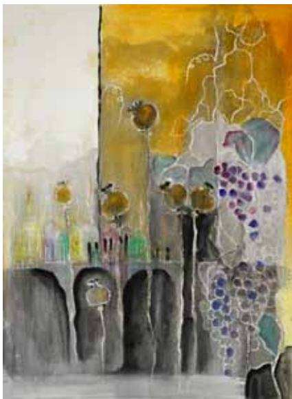
Marija EFREMOVA Papaveri, 2020 akril na platnu