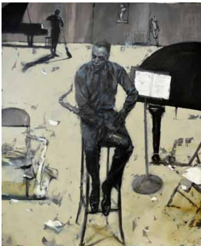
Viktor ŠEST Notranjost, 2020 olje na platnu

Viktor Šest je leta 1981 diplomiral na oddelku za slikarstvo ljubljanske Akademije za likovno umetnost. Živi in ustvarja v Mariboru. Zanima ga predvsem človek. S svojo ustvarjalnostjo mu je pripravljen tudi pomagati.