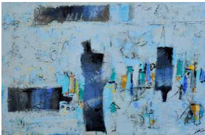
Azad KARIM Dežela upanja, 2020 akril na platnu