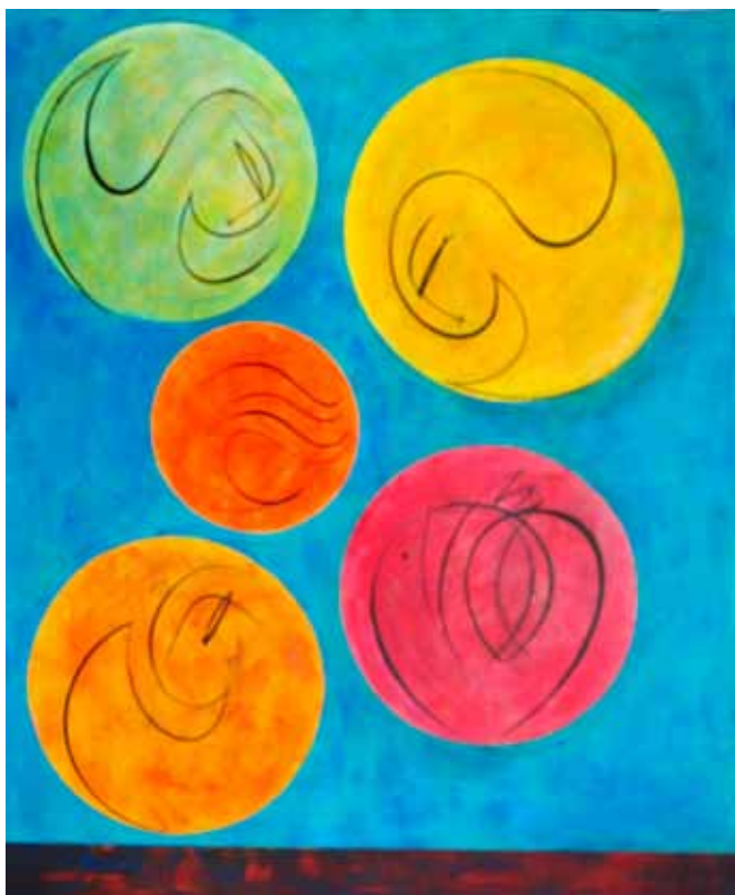
Matej METLIKOVIČ Luči na nebu duše, 2020 akril na platnu

Matej Metlikovič je akademski slikar, ki se je uveljavil tudi z močno avtorsko zaznamovano likovno opremo sakralnih prostorov ter z obsežnim opusom, s katerim ustvarja slikarsko interpretacijo svetopisemske tematike.