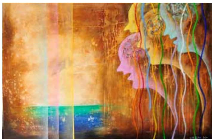
Vinko PRISLAN Kdo ve, kdo je kaj in kdo je kdo (iz cikla Potovanja), 2020 akril na platnu