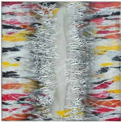
Milena GREGORČIČ Svetlobe, 2020 akril na platnu