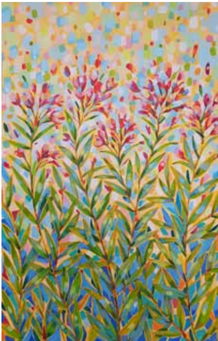
Alina ASBERGA NABERGOJ Cvetoč oleander, 2020 akril na platnu