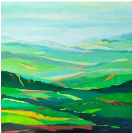
Joso KNEZ Sinji vrh, 2020 akril na platnu