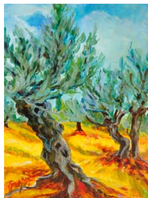
Vojko GAŠPERUT Oljke, 2020 akril na platnu