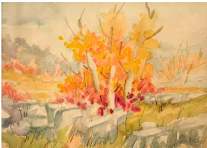
Andrej KOSIČ Svetloba med drevesi, 2020 akvarel