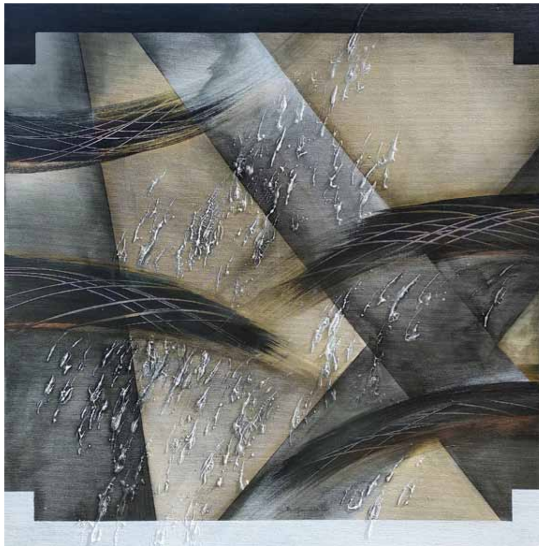
Milena GREGORČIČ Linije akril na platnu, 2021, 80 x 80 cm