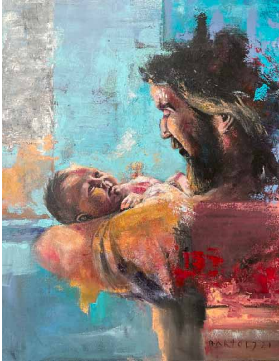
Jože BARTOLJ Z očetovim srcem akril na platnu, 2021, 90 x 70 cm