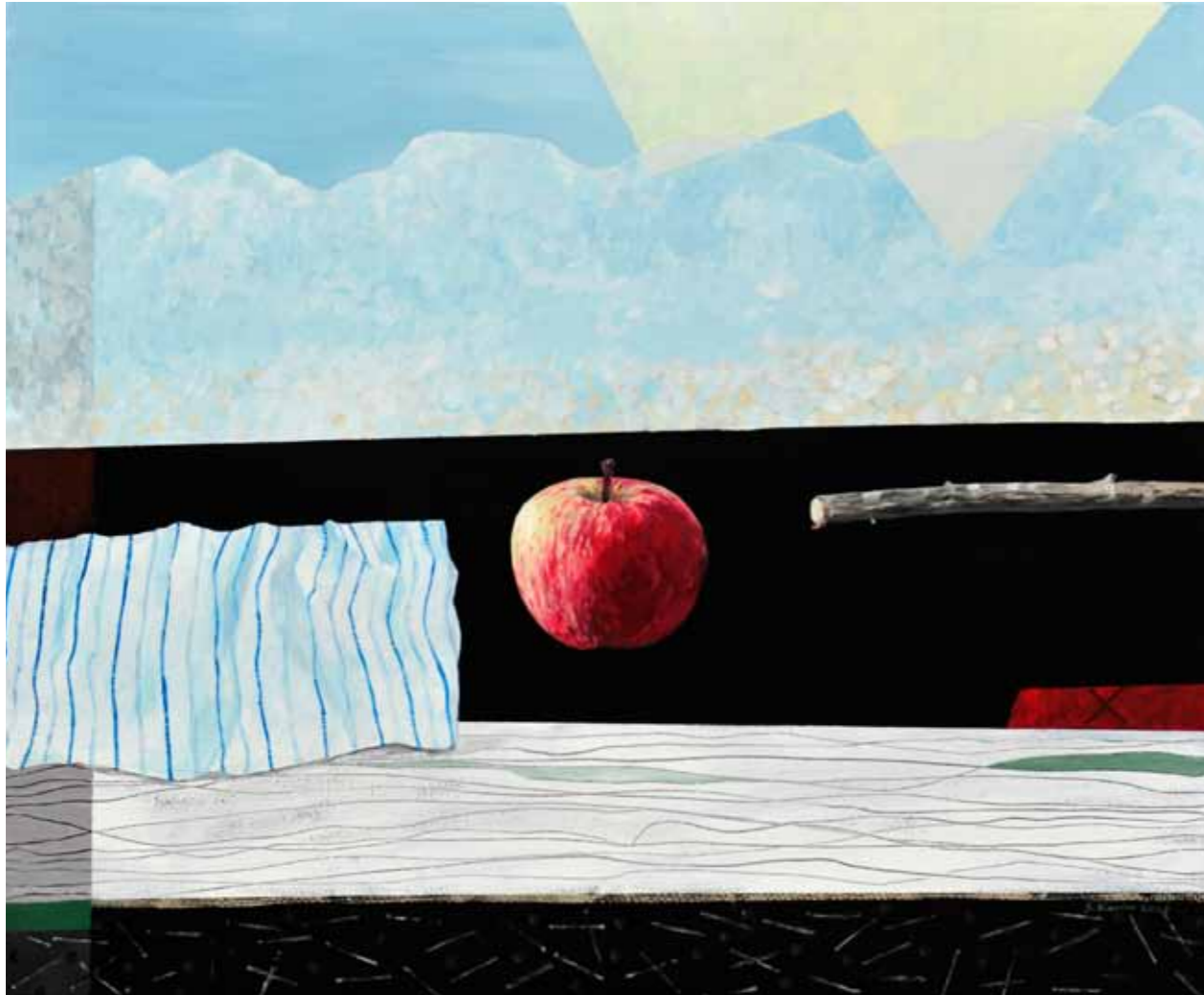
Silva KARIM Nad sotesko