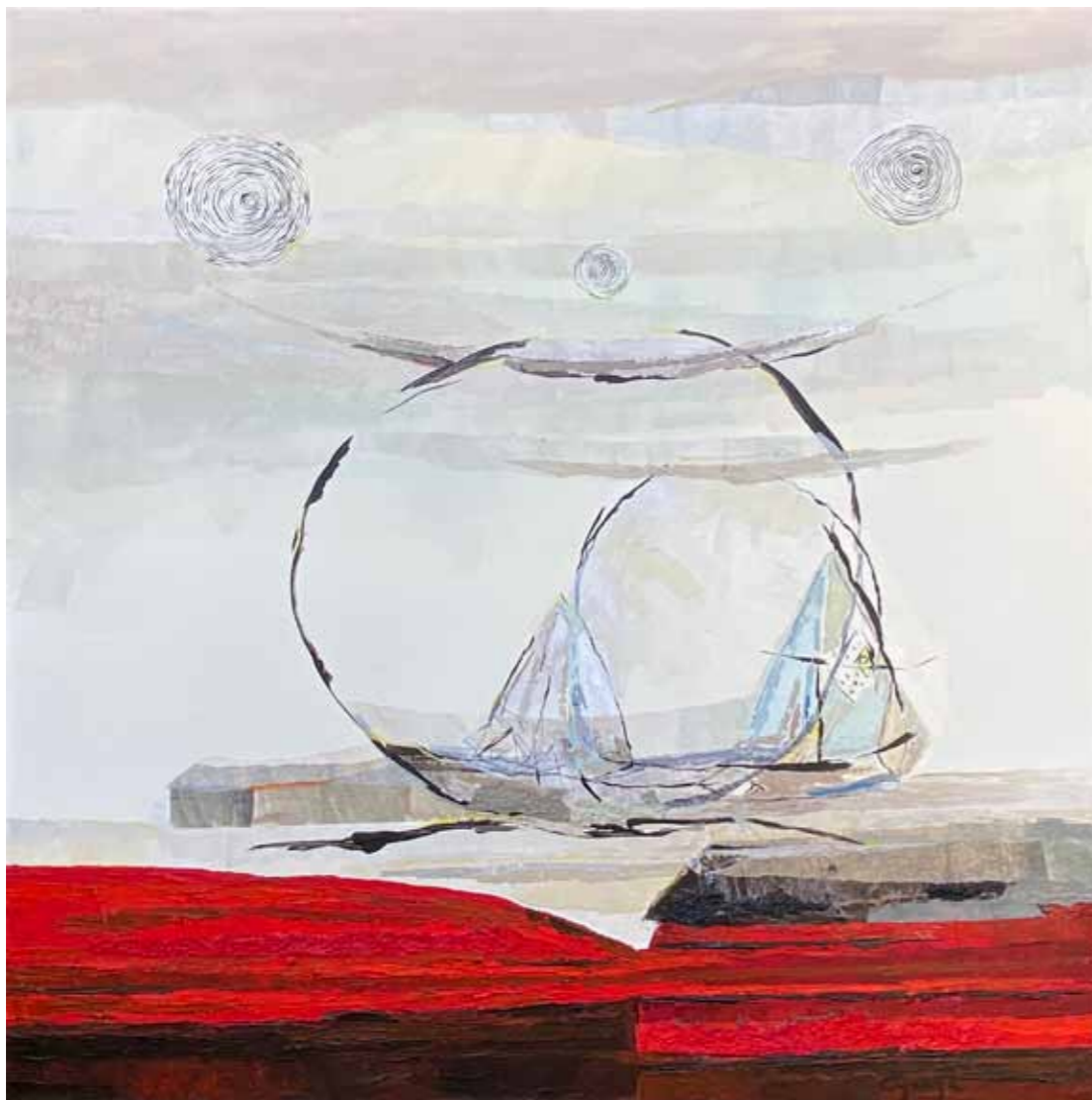
Klementina GOLJA Iz cikla »Več kot pogled«

mešana tehnika na platnu, 2021, 80 x 80 cm