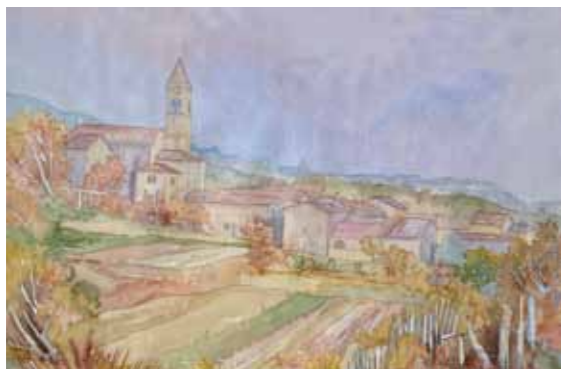
Andrej KOSIČ Črniče akvarel na papirju, 2021, 57 x 38 cm