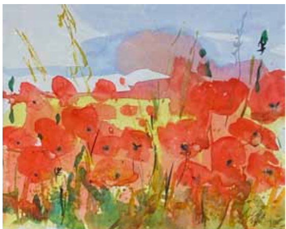
Janez OVSEC Maki akvarel na papirju, 2021, 25 x 30 cm