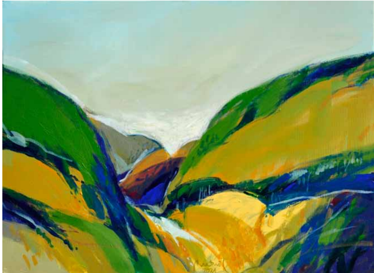
Lucijan BRATUŠ Telo pokrajine I. akril na platnu, 2021, 60 x 80 cm