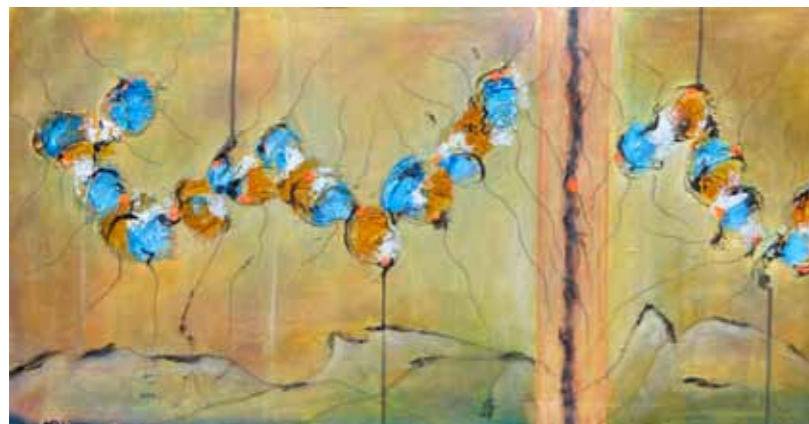
Vinko PRISLAN Iz cikla "Vilinski ples" - Drevo življenja akril na platnu, 2021, 80 x 100 cm