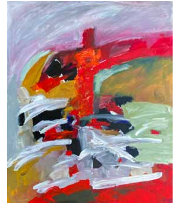
Vivijana KLJUN Pod razpelom akril na platnu, 2018, 100 x 80 cm