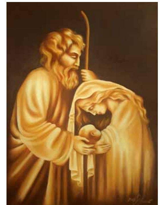
Patricija RIJAVEC SIMONIČ Sveta Družina olje na platnu, 2018, 60 x 45 cm