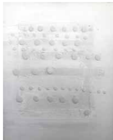
Breda Sturm Obrni nov list/Turm a New Page mešana tehnika, 2015, 80 x 100 cm