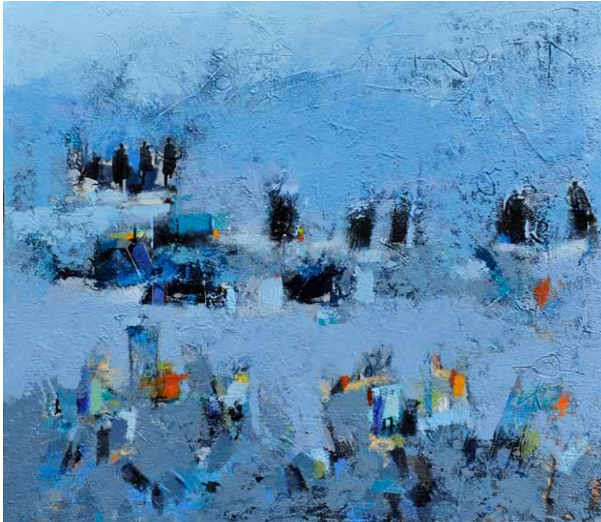
Azad KARIM Pozabljeni spomini akril na platnu, 2021, 80 x 90 cm