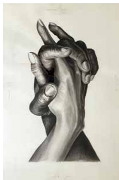
Tadej Žugman Roke risba na papirju, 2021, 100 x 70 cm