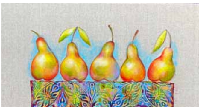
Alina ASBERGA NABERGOJ Hruške akril na platnu, 2021, 30 x 60 cm