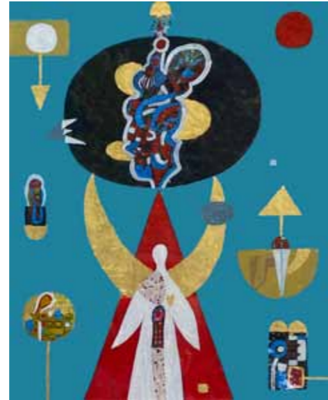
Lona VERLICH Moj angel

mešana tehnika na kartonu, 2020, 55 x 46 cm