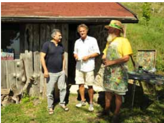
Dolgoletni sodelavci kolonije Umetniki za karitas