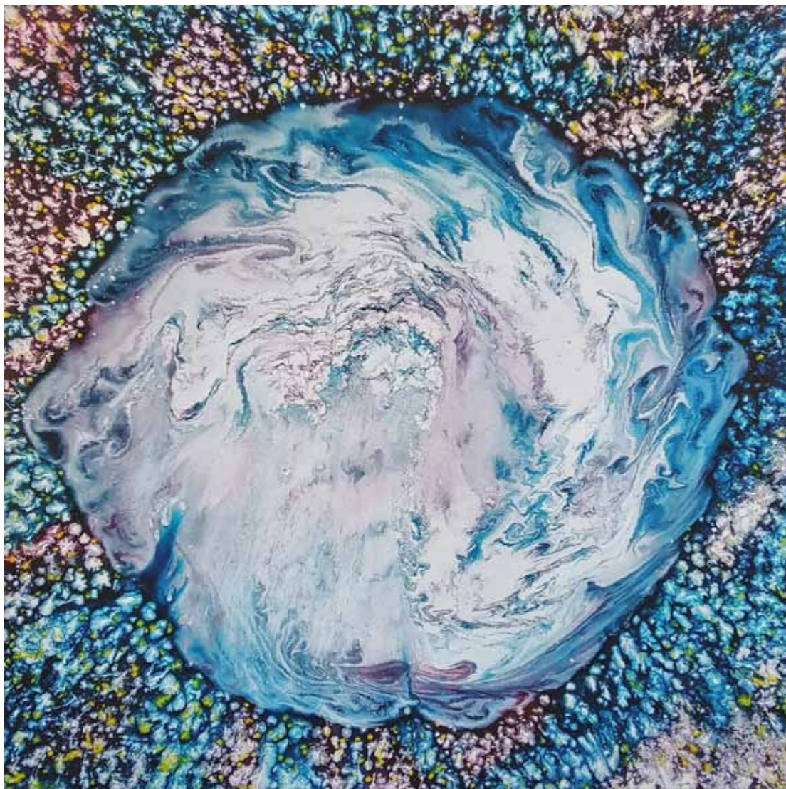
Janez ŠTROS Tudi ti si angel tisk na platnu, 2021, 90 x 90 cm