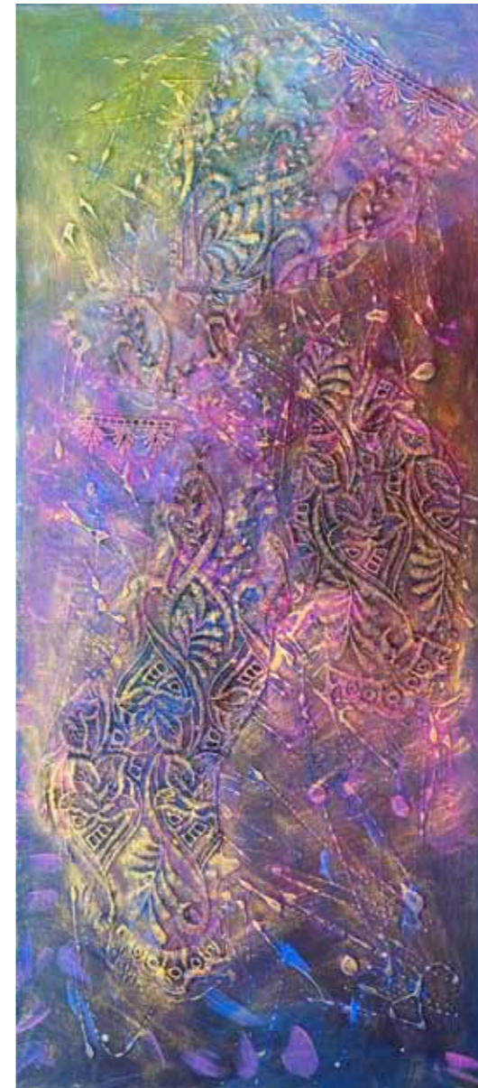
Erna FERJANIČ Svetlikanja II. akril na platnu, 2021, 90 x 40 cm