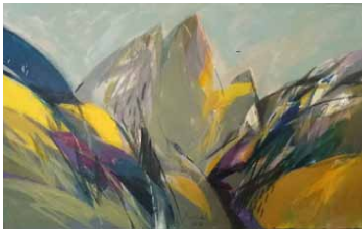
LUCIJAN BRATUŠ Gora, 2018 akril na platnu