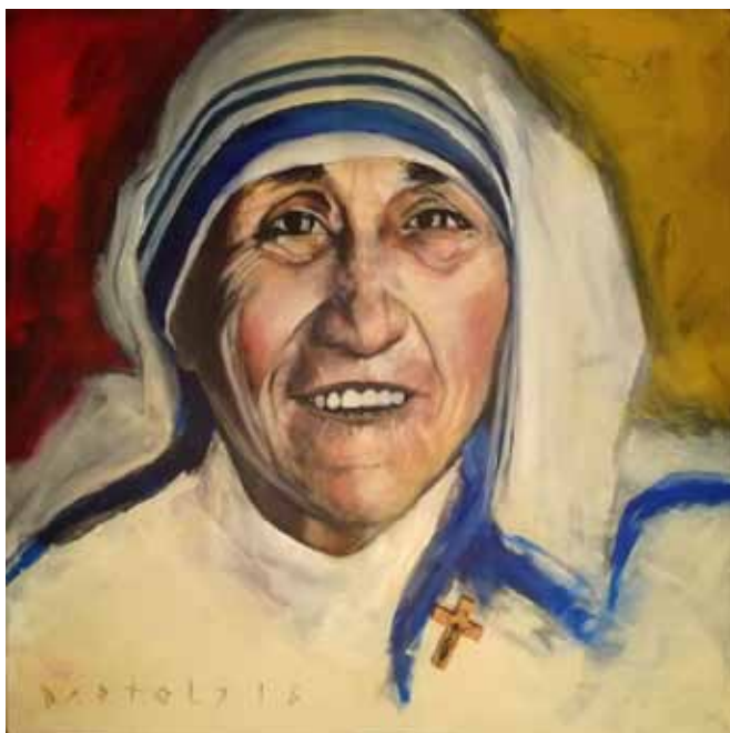
JOŽE BARTOLJ Mati Terezija, 2018 akril na platnu

Tudi mednarodna likovna kolonija Umetniki za karitas praznuje Cankarjevo leto. Ob 100. obletnici smrti največjega slovenskega pisatelja je potekala pod geslom