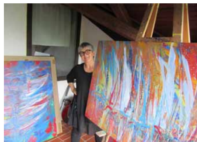
Mira v elementu ...