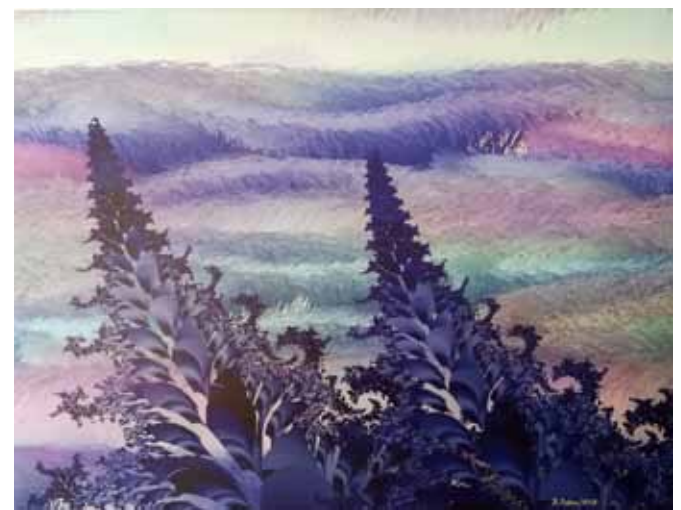
BOGDAN SOBAN Krajina, 2018 računalniška grafika