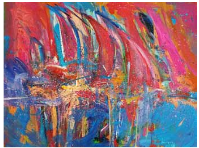
MIRA LIČEN KRMPOTIĆ Jadrnice, 2018 akril na platnu