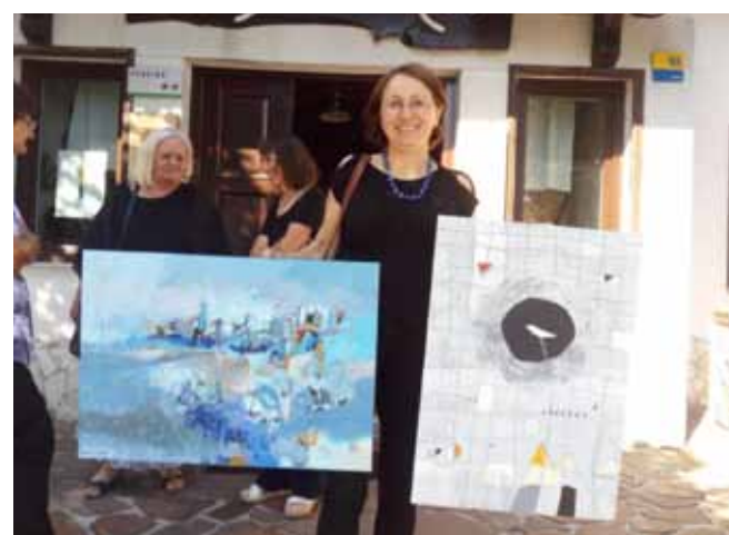
Nekateri slikajo kar doma in na dan odprtih vrat prinesejo svoj dar ...