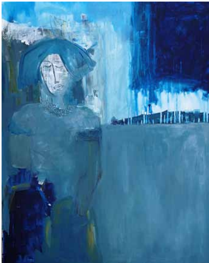
VIVIJANA KLJUN Sinja, 2018 akril na platnu

Vivijana Kljun je razpeta med Sežano in Trstom, že vse od mladosti pa z največjim veseljem domuje na področju likovnega ustvarjanja. Njen talent so opazili že v osnovni šoli, v gimnaziji pa je imela tudi svojo prvo razstavo. Kasneje je bila povezana z različnimi kreativnimi področji, od leta 2005 dalje pa sledimo njenemu slikarskemu delovanju in kontinuiranemu razstavljanju.