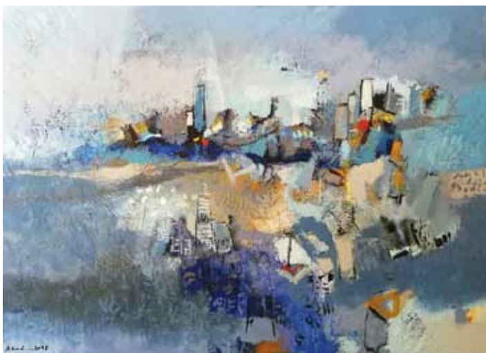
AZAD KARIM Dežela upanja, 2018 akril na platnu