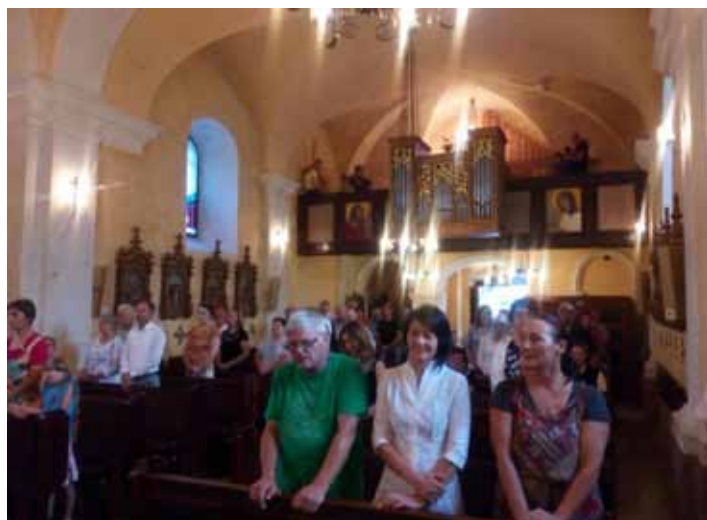
Maša za pokojne umetnike