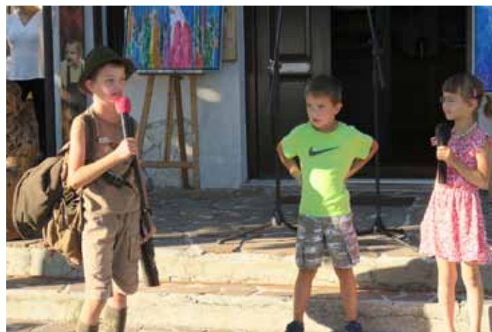
Mladi z gore so obiskovalce nasmejali ..., kot vedno.