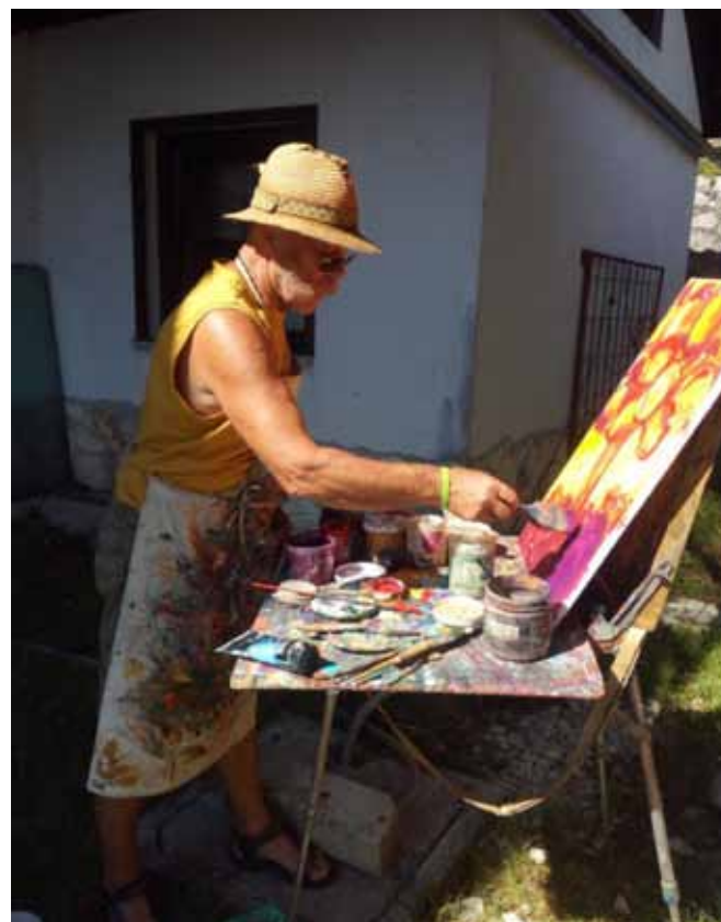
Veljko vedno v svojem kotičku ...