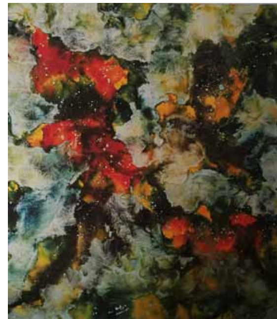
JANEZ ŠTROS Tudi ti si angel, 2018 olje na platnu