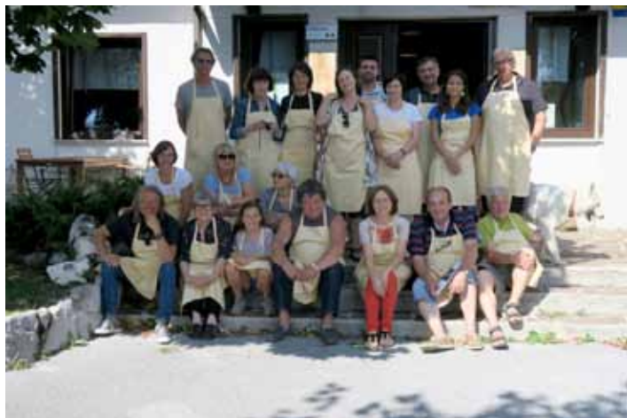
Prvi dan kolonije ...