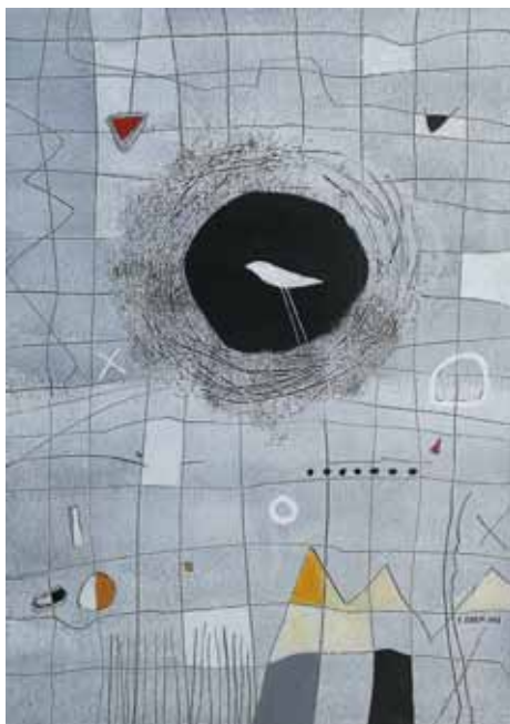
SILVA KARIM Gnezdo, 2018 akril na platnu