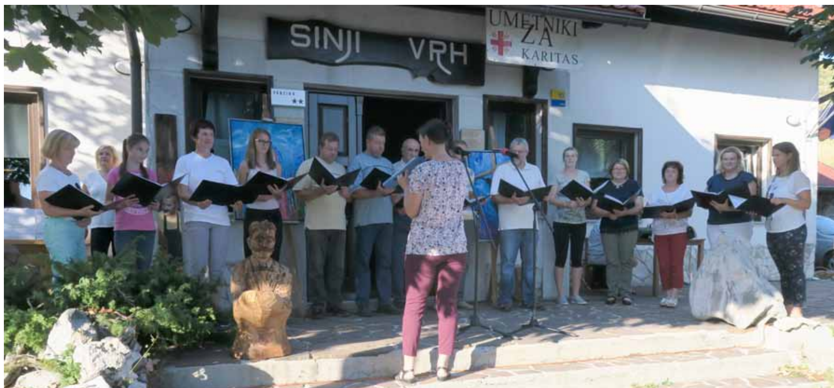
Pevski zbor Angelski spev