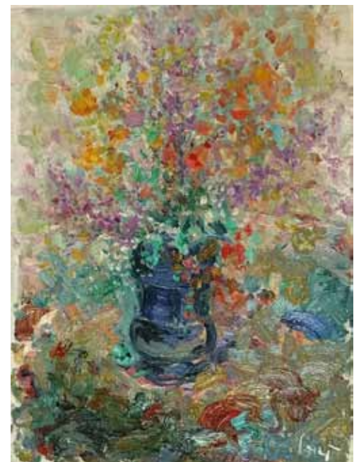
STONE SEIFERT Šopek zate, 2018 olje na platnu